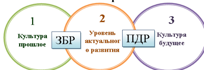
Рис 1. Структура образовательного процесса в дошкольном возрасте